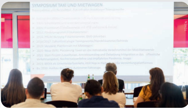
Viele Informationen und aufmerksame Zuhörer aus ganz Deutschland in den Seminaren, dazu in den Pausen und am Abend ein reger Austausch. Das sind die Kennzeichen für „Update 2024: PBefG-Instrumente rechtssicher nutzen – Städte lernen von Städten“.

Auch wenn die Novelle des Personenbeförderungsgesetzes bereits ihren dritten Geburtstag feiert – es herrscht nach wie vor viel Unsicherheit über den Umgang mit den im PBefG verankerten Möglichkeiten für die Städte. Der Bundesverband hat darum gemeinsam mit dem Deutschen Städtetag bereits im vergangenen Jahr in Hamburg für Nachhilfe gesorgt. Und auch in diesem Jahr ist die Veranstaltung (im September in Frankfurt/Main) bereits ausgebucht.