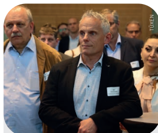
Aufmerksam verfolgten Politiker und Gewerbevertreter die Debatte.

erleben wir gerade zwischen Plattformunternehmen und Taxis“, so Kollar. „Und in den anderen Gebieten ist Politik noch nicht ehrlich genug! Weil: Da werden Sie mit diesen normalen Marktmechanismen nicht zurecht kommen. Dazu ist die Fläche zu groß, die Nachfrage in den einzelnen Gebieten zu gering, als dass es da einen Wettbewerb von Unternehmen um die Fahrgäste geben könnte“. Zudem könne man den Menschen im ländlichen Raum auch nicht zumuten, den wahren Preis für die Mobilität zu bezahlen, weil das auch Großstädter nicht zahlen müssten. Kollar: „Ich zahle nicht das, was das Angebot mit U-Bahn, Strassenbahn und Bus kostet. Ich zahle nur einen Bruchteil davon. Und der Bevölkerung auf dem Land mutet die Politik derzeit zu: Zahlt mal den Taxitarif!“. Das Fazit des Präsidenten, an seine beiden Diskussionspartner gewandt: „Wenn Politik ehrlich ist und sagt, wir wollen ein annähernd gleiches Mobilitätsangebot oder wenigstens ein Grundmobilitätsangebot auf dem Land haben, dann werden Sie Geld in die Hand nehmen müssen. So wie es im städtischen Bereich